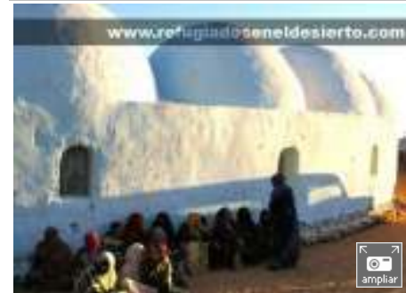
Y ahora qué hacemos, fotografía de la exposición Refugiados en el desierto

Los organizadores del evento denuncian que "desde hace 33 años", cuando España se marchó de su última colonia, los saharauis viven refugiados en los campos de Tinduf. El Alto Comisionado de las Naciones Unidas para los Refugiados nunca ha podido contar a los refugiados, que ascienden, según el Polisario, a 160.000, mientras que Rabat