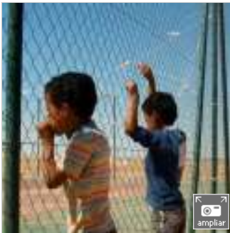
La valla, fotografía de la muestra Refugiados en el desierto , que puede verse en 25 bares de toda España.

Un fallo del fiscal pone en peligro la nacionalización de 800 saharauis